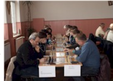
Entscheidung der BOL: Schmiedeberg - Löberitz II

Aus den Landesklassen kommen Pratau und Aken in die BOL Dessau, die damit äußerst stark besetzt sein wird in der kommenden Saison. Gratulation allen Aufsteigern: USC Magdeburg in die Oberliga, Piesteritz in die Landesliga, Löberitz II in die Landesklasse, Piesteritz II in die BOL, Holzweißig II in die Bezirksliga und Wolfen III in die 1. Bezirksklasse.