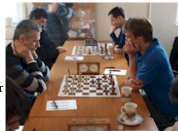
Die letzte Runde