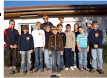
Alle SK Teilnehmer

In der U 10 und U 16 sogar Kompletterfolge