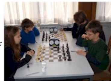
Brett eins und zwei