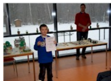
Der stolze Bezirksmeister

Die Bezirksmeisterschaften gehen morgen in der Dessauer Jugendherberge (Ebertallee) zu Ende.