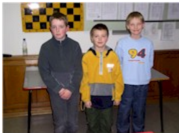
Die drei Ersten