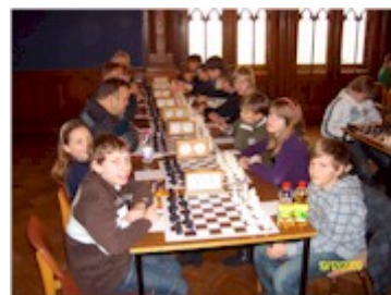
Ansetzungen der zweiten Runde