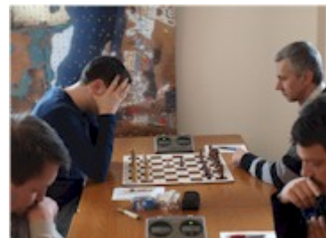
Die Spitzenpaarung der vierten Runde