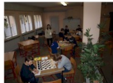
Der Kampf beginnt

Ein 2,0 : 2,0 in Sangerhausen beschert der U 14 Mannschaft ersten Teilerfolg. Sogar ein Sieg war im Bereich des Möglichen.