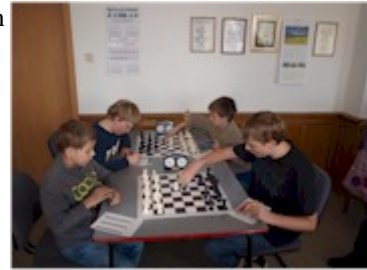
Brett drei und vier

Zum fälligen Punktspiel in der U 14 kam es heute zum Lokalderby zwischen unseren Jungs vom SK und der Mannschaft des 1. SC Anhalts. Leider konnten wir nur zu dritt antreten, während Anhalt mit vier Spielern antrat. Am Ende gewannen wir mit 2,5 : 1,5. Damit kann zumindest Anschluss an das Mittelfeld der Tabelle gestellt werden. Bereits nächsten Sonntag muss in Merseburg gegen eine Spitzenmannschaft gespielt werden.