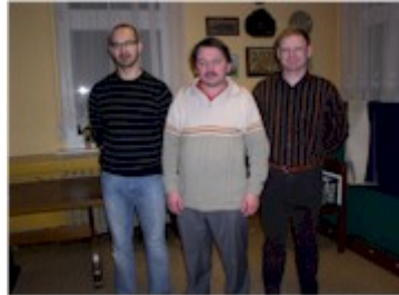
Die drei Ersten