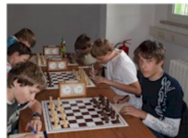
SV Merseburg (links) - SK Dessau 93

Die klare 1 : 3 Niederlage war absolut vermeidbar. Die Merseburger hätten sich nicht beschweren können, wenn es ein 2 : 2 geworden wäre.