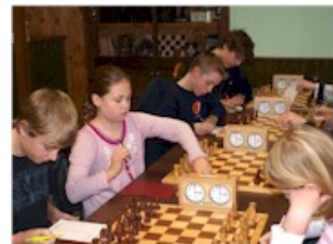
Der Kampf beginnt!