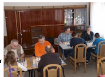
Pokalfight SK gegen Köthen

Nun muss bereits am 25.04.2009 in Sangerhausen zum Viertelfinale des Landespokal angetreten werden.