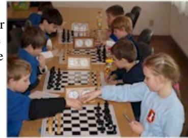
Gräfenhainichen (links) gegen Dessau

14. März 2009 –Bezirksausscheid U 10 Mannschaft: Leider sagten die Löberitzer kurzfristig ab, so dass nur VfL Köthen, der SK Dessau 93 und der gastgebende VfL Gräfenhainichen die zwei Qualifikanten zum Landesfinale ermittelten. Die Köthener konnten nur die zweite Garnitur schicken, weil die erste Auswahl an einer Schulschachveranstaltung teilnahm. Die Terminnot wird auch beim Schachnachwuchs immer größer und wird bald nicht mehr zu bewältigen sein.