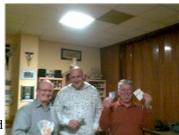
Die ersten Drei

Ein gelungener Abend kurz vor Jahresende war es für unsere Skatspieler und solchen aus anderen Vereinen auf jeden Fall.