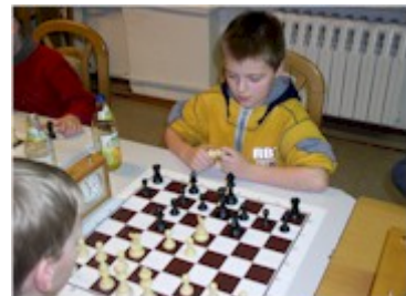
Der Sieger in Aktion

08. Januar 2009 - BJEM: Heute findet das Neujahresblitzturnier unserer Schachkinder ab 15.30 Uhr im Trainingslokal Kienfichten statt.