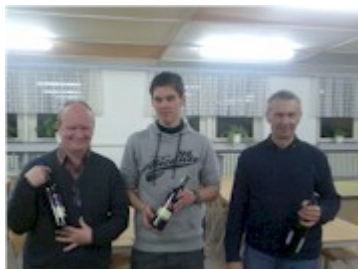
Die drei Ersten